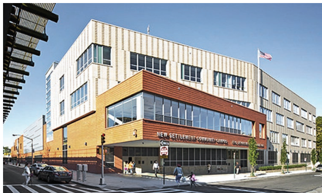
New Settlement Community Campus