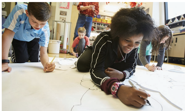
The Gateway School