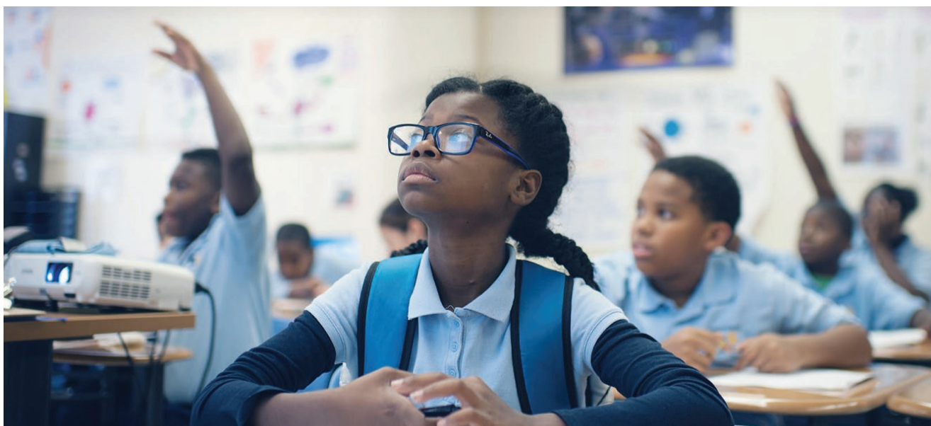
Great Oaks Charter School